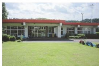
北栄町社会福祉協議会 栄保育所 北栄町下種373-4 TEL 0858-37-2626