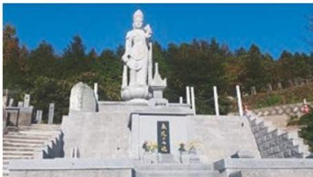
聖観音・永代供養