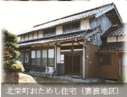
北栄町おためし住宅（妻波地区）