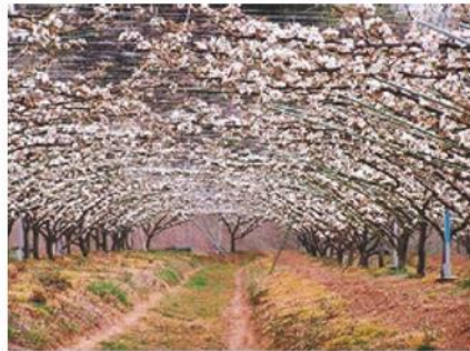
満開の二十世紀梨