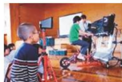
自転車シミュレーター講習