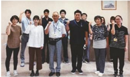
一緒に楽しく働きましょう!!