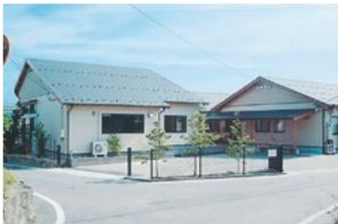
北栄グループホーム・デイサービス