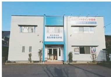
中央予備校・倉吉本部教室

鳥取県中・西部の小・中学生が約15名来てくれています。学校も学年も違う生徒たちが和気あいあいと生活しています。勉強だけでなく様々な体験活動を通して皆さんの刺激を受けてほしいと心から願います。