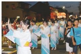
倉吉打吹まつり～みつぼし踊り