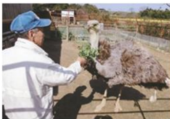
ダチョウにエサやりをする入居者