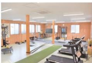
一般開放しているトレーニングジム