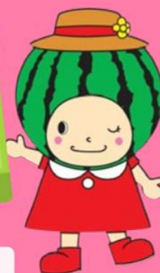
大栄西瓜マスコットキャラクター 夏味ちゃん