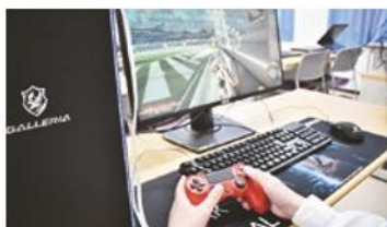
県内初のeスポーツ部