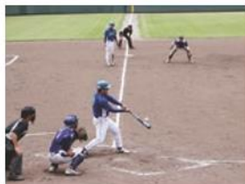
若さ躍動！くらしん野球部