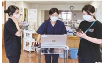
ICT活用による既成概念に捉われない「おしゃれでスマートな介護」にチャレンジしています